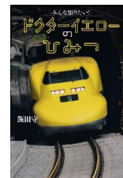
☆『みんな知りたい！ドクターイエローのひみつ』 飯田守／著 講談社 2014年

時こくひょうにのっていない黄色い新かん線「ドクターイエロー」は、新かん線が走るための電気やき道（レール）などのせつびをけんそくする試けん車です。そのはたらきをプロのぎじゅつしゃたちにしゅざいしました。チームで安全を守る様子がよくわかります。