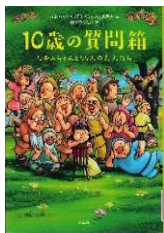
☆『10歳の質問箱』 日本ペンクラブ「子どもの本」委員会／編 鈴木のりたけ／絵 小学館 2015年

こまっていることやなやんでいることがある人は、この分野の本を読んでみてください。きっと、あなたの生きるヒントが見つかります。