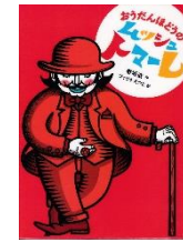
『おうだんぼどうの ムッシュトマーレ』 香坂直／作 フィリケえつこ／絵 小学館 2015年

気持ちがもやもやしたり、い つもの自分でいられないと き、おうだんぼどうの見はり 番、ムッシュ・トマーレはあ らわれます。その気持ちのま ま、物事を前に進めてもいい のか、トマーレは問いかけて きます。立ち止まって、ゆっ くり自分の気持ちを考え直 すことの大切さを教えてく れる1きつです。