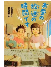
『お屋の放送の時間です』 乗松葉子／作 宮尾和孝／絵 ポプラ社 2015年

4年生になり、ねんがんの放送 委員になった、かえで。たん当 曜日を友だちといっしょの日に しようと思っていたのに、こう へいとペアになってしまいました。 こうへいは、きいきいうる さくて、おさるみたいなので、 苦手な男の子。やりたい放送の 内ようも全ぜんちがいます。か えでのお屋の放送は前途多難 (ぜんとたなん)です。