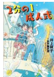
『2分の1成人式』 井上林子／著 新井陽次郎／絵 講談社 2015年

だれにでもなやみはあるはず。なやみの対処法（たいしょほう）は人それぞれで、正かいはひとつではありません。この本には、まわりの大人たちからはえられないような意外な提案（ていあん）ものっています。あなたが自分で考え判断（はんだん）する時、さんこうにしてみてください。