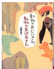
☆『動物のおじいさん、動物のおばあさん』 高岡昌江／文 すがわらけいこ／絵 学研教育出版 2014年

本書には日本の動物園にいる、7頭のおとしより動物がしょうかいされています。人間と同じように動物にも人生があります。どんなことを乗り越え、どんな毎日を生きているのでしょうか。飼育係（しいくがかり）にお話を聞いてみました。動物たちに会いに行きたくなりますよ。