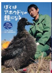
☆『ぼくはアホウドリの親になる』 南俊夫／文・写真 山階鳥類研究所／監修 偕成社 2015年

らんかくや火山ふん火によりぜつめつすん前のアホウドリをほごするため、小笠原諸島（おがさわらしょとう）の鳥島（とりしま）からむ人とうの聳島（むこじま）へ、ひなを引っこしさせる取り組みが行われました。ほうふな写真とともに、子どもたちにもわかりやすい文章で、活動の様子をつたえます。