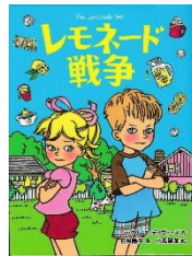
『レモネード戦争』 ジャクリヌ・デイヴィーズ／作 日当陽子／訳 小栗麗加／絵 フレーベル館 2014年

アメリカでは、子どもたちが 家のしゅうへんでレモネード スタンドという小さなお店を 開くかんしゅうがあります。 エヴァンとジェシーの兄妹 は、あるきっかけでケンカに なってしまう、レモネードス タンドの売り上げの多さで決 着をつけることになりました。 2人のケンカの行方はど うなるのでしょうか。